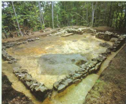
Gradec, poznoantična cerkev (druga polovica 5. in 6. stoletje)