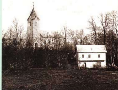
Miklavž okoli 1900 (hrasl Dolenjski marej)